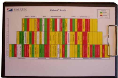
Auditoria Breakthrough KAIZEN™